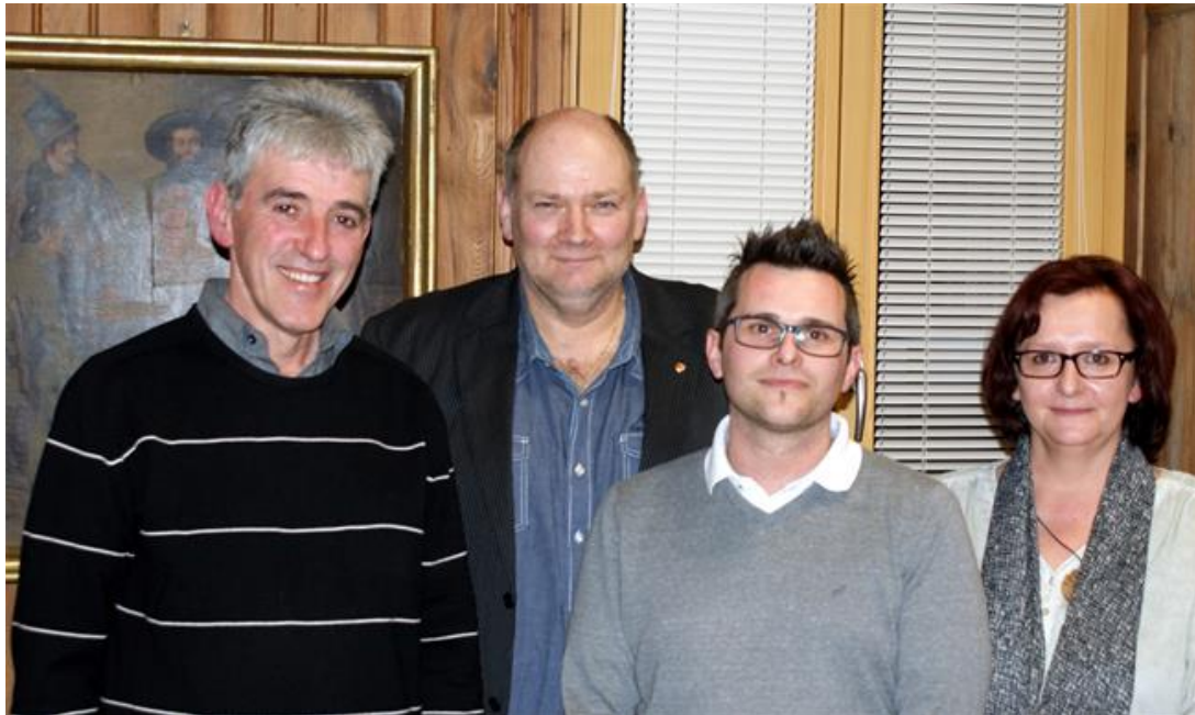
der neue Gemeindevorstand der Gemeinde Stanz

In der konstituierenden Sitzung wurde die Gemeindevorstandswahl abgewickelt.