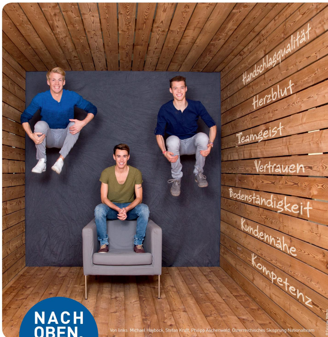
Von links: Michael Hayböck, Stefan Kraft, Philipp Aschenwald, Österreichisches Skisprung Nationalteam