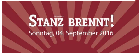
Bei Stanz brennt